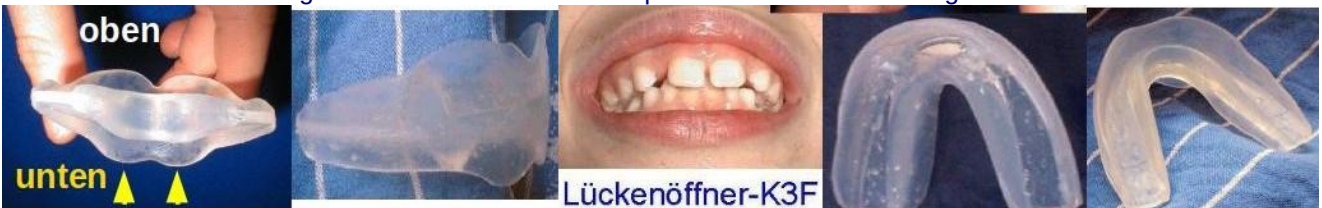
Bild ganz rechts = Sonderanfertigung: Enden länger (für 32 große Zähne) und verdickt (gegen offenen Biss)

Lieferzeit für nicht vorrätige / individuelle EVA-Thermoplast K3Fs: ca. 7 – 10 Tage.