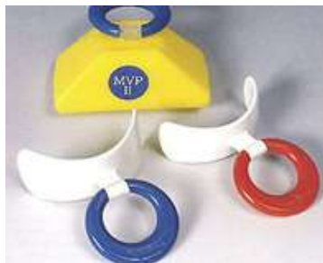
Mundvorhofplatte (3 – 5 Jahre)

Mundatmung → Zunge ruht im Unterkiefer, Oberkiefer bleibt schmal