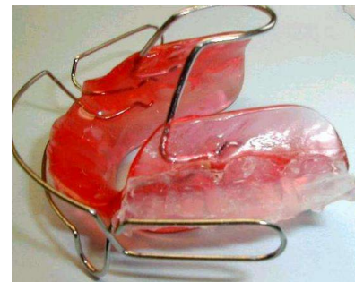
Bionator nach Balters